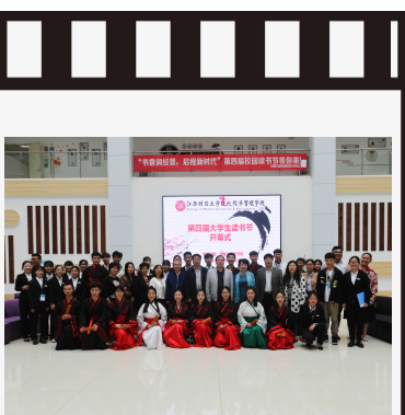
第四届大学生读书节开幕式