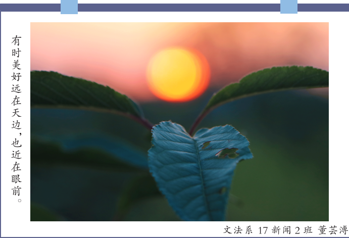
文法系 17 新闻 2 班 董芸涛