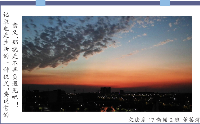
文法系 17 新闻 2 班 董芸涛