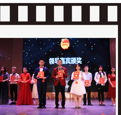
第十届校园十佳歌手决赛圆满落幕