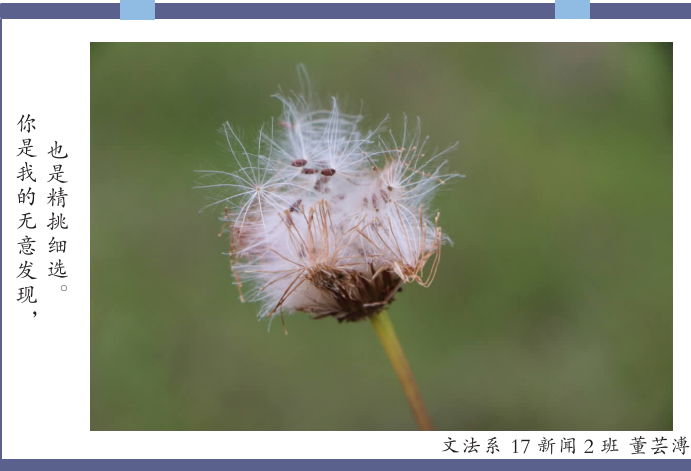
文法系 17 新闻 2 班 董芸涛

日出是你,日暮是你。花开两季,用镜头记录现经管的点点滴滴。四时之景,眼中皆是你。【编辑:盛相仪】