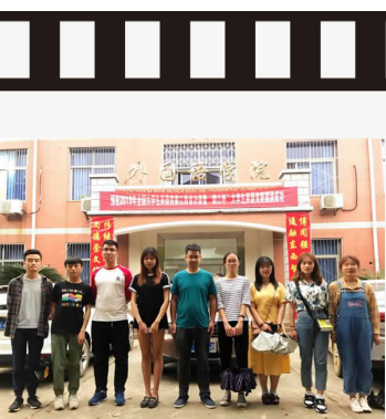
全国大学生英语竞赛暨赣江杯 大学生英语竞赛再传捷报